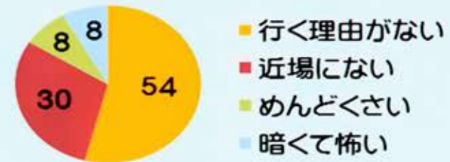
神社に行かない理由 (100人にアンケート)

参拝者が増え、神社が活性化する ことで、神社を通じた地域の人々の 繋がりが深まる