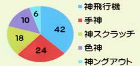
各アイデアに対する興味度 (100人にアンケート)