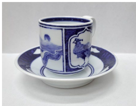
「カップアンドソーサー」(陶芸)